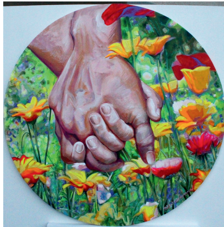
2024 Acrilico su tela Diametro 100cm

"ARTigiano Creativo", nasce nel 1962 a Busto Arsizio, compie i suoi studi presso l'Accademia di Belle Arti a Milano. Dopo una prima esperienza da restauratore, inizia a lavorare come cartellonista pubblicitario. Poi, negli anni 2000, le sue prime performances, dedicandosi alla ritrattistica e alle copie d' autore. Si esibisce in tutta Italia e nel 2011 vince la seconda edizione di Italia's Got Talent. E' tra i 10 migliori performer al mondo che dipingono in "upside down", per qualità e velocità.