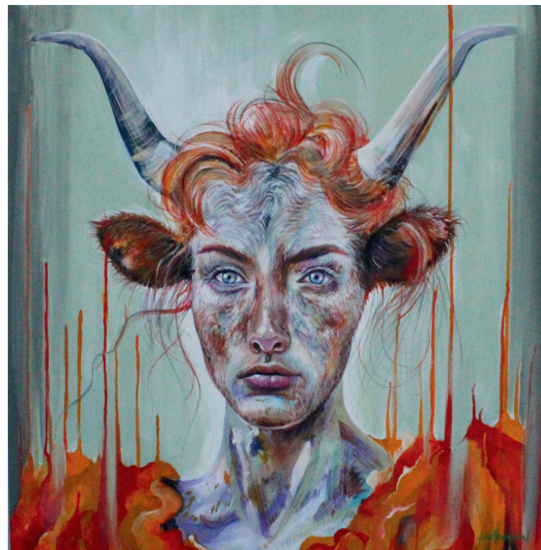
2024 Acrilico su tela 70x70cm

Nata a Rho nel 1986, segue le orme del padre conseguendo la laurea in scultura, presso l'Accademia delle Belle Arti a Milano. Durante gli studi si appassiona al face painting e ha modo di conoscere molte persone che lavorano nel mondo dell'intrattenimento. Da qui nasce l'interesse e la dedizione per gli eventi con i bambini, tanto da diventare un lavoro vero e proprio.