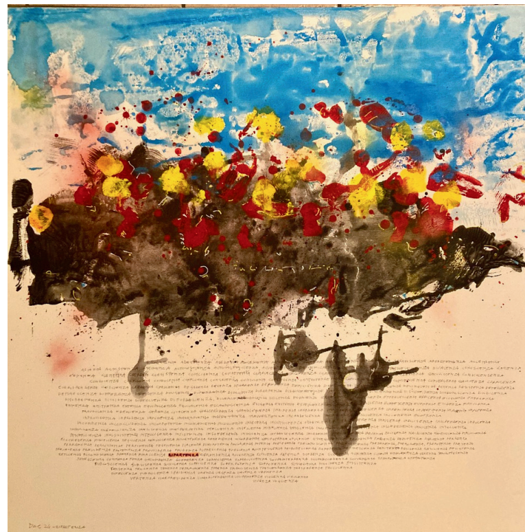
2024 Acrilico su tela 100x100cm

Medico e artista del 1956; considera l'arte e la medicina due mondi che sembrano così distanti, eppure così vicini. Il medico è un artista che osserva un'opera (il paziente) e genera un processo creativo per comprenderlo e curarlo. L'artista invece genera un processo creativo che vuole essere osservato e compreso per suscitare un'emozione.