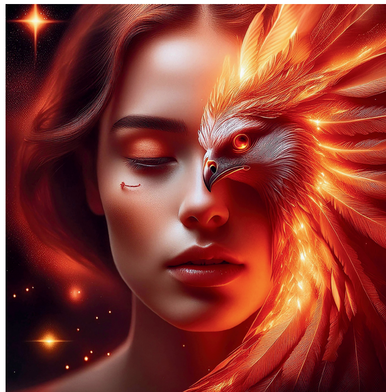
2024 Aerografo e pastelli su DBond (alluminio) 90x90cm

Nasce a Rovello Porro nel 1951, si diploma nel 1968 alla scuola d'Arte di Como. Si iscrive e frequenta l'Accademia di Belle Arti di Brera a Milano. E' di quegli anni la ricerca grafica e pittorica sulle opere di Klee, Kandinski, Vasarely e di tutti i pittori che fanno riferimento alla scuola tedesca. Nel 2003 scopre la pittura animalista e la corrente della Wildlife Art restandone affascinato.